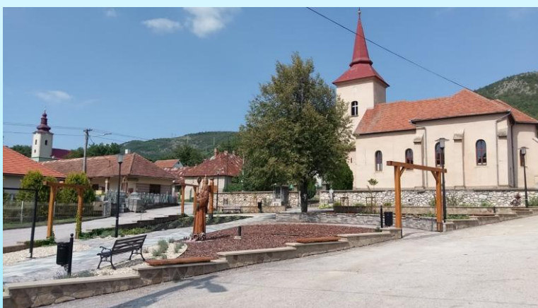
Fotografia po realizácii projektu