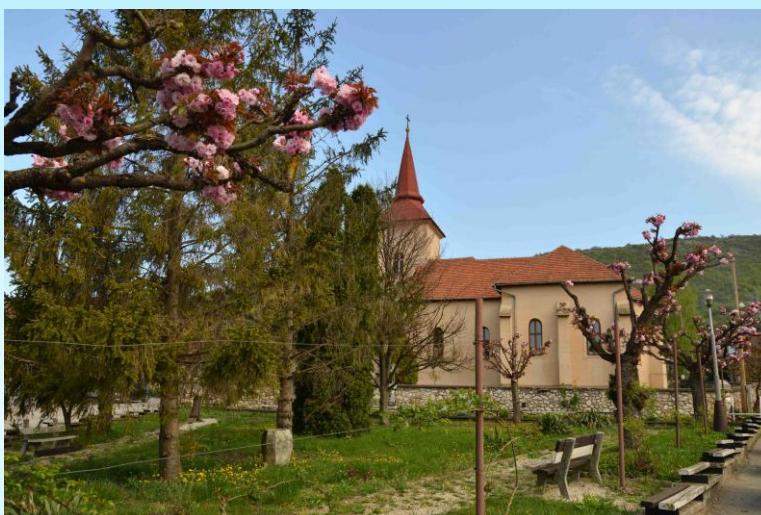
Fotografia pred realizáciou projektu

Viac informácií o zrealizovanom projekte z PRV SR 2014 – 2020 nájdete na webovej stránke NSRV SR .