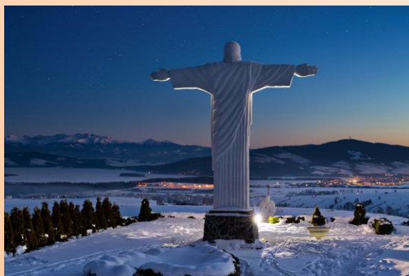
Kategória "Naše naj"