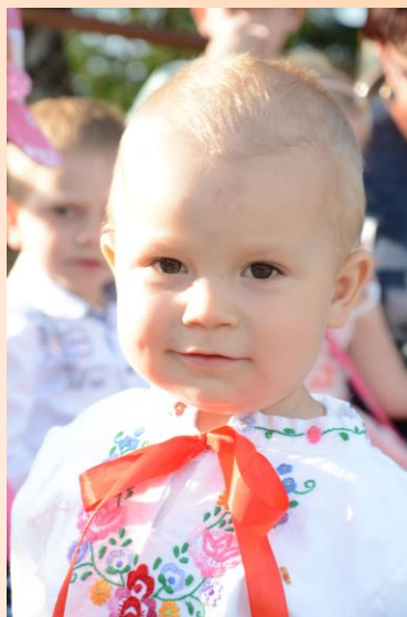
Kategória "Naša budúcnosť"