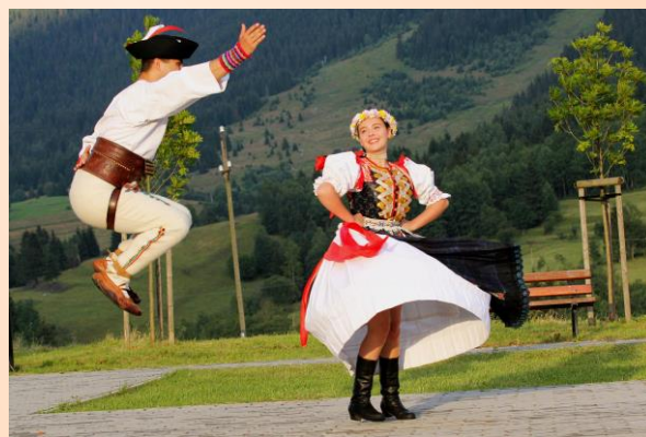
Kategória "Naše kroje"