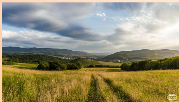
Kategória "Život v našej MAS/VSP"