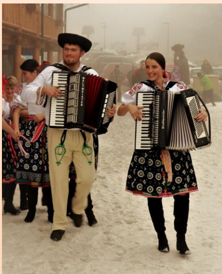
Kategória "Naši ľudia"